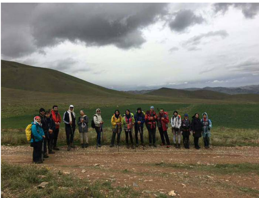
ابتدای عقیل آباد