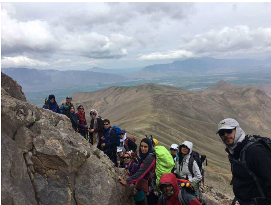
دست به سنگ نزدیک قله