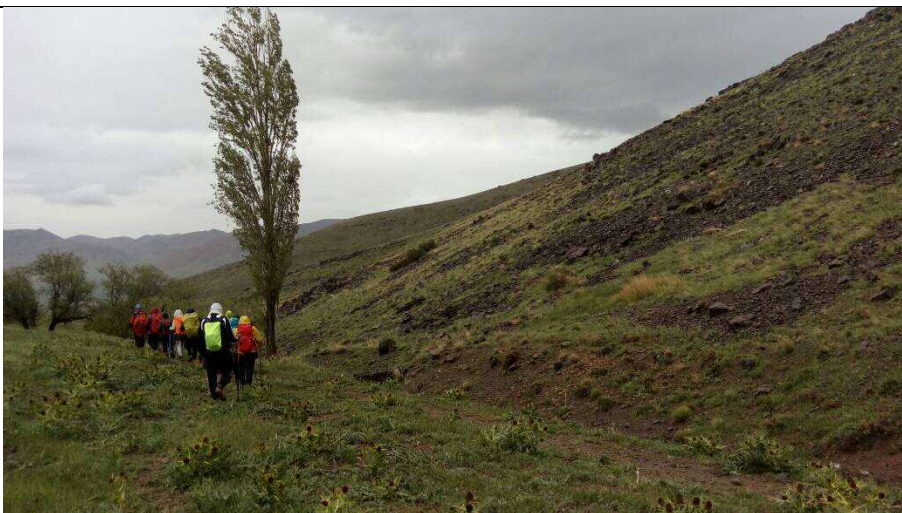
فرود به سمت روستای عقیل آباد