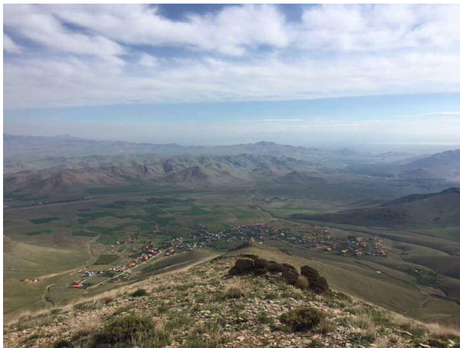
نمایی از روستای خانه میران