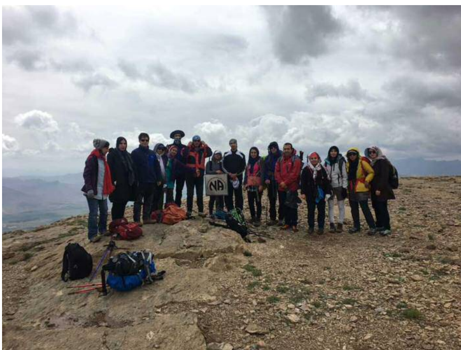
قله سفید خانی