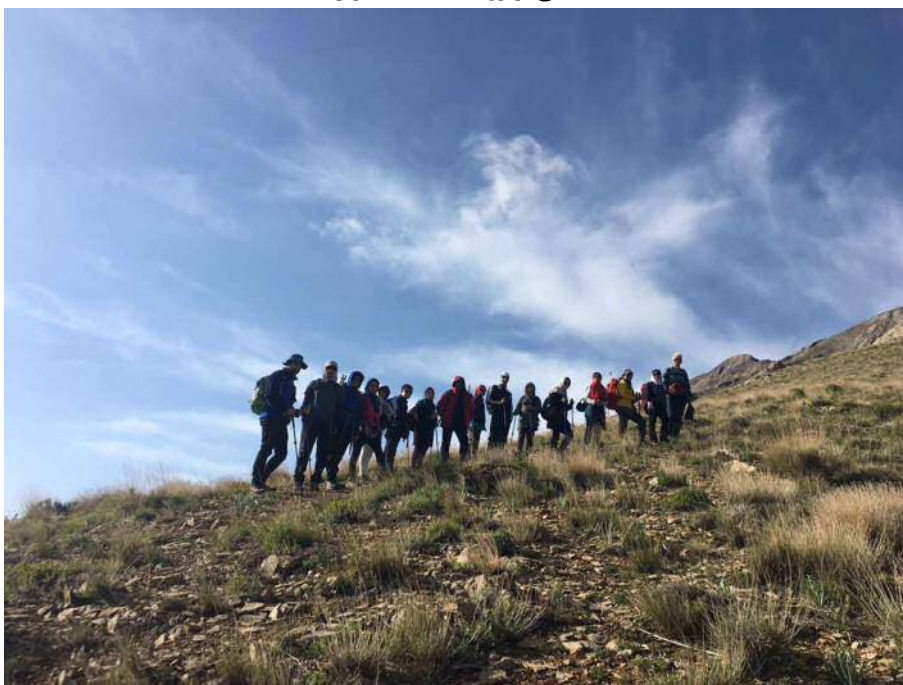
ابتدای یال صعود